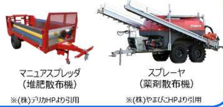
トレーラタイプ農作業機の例

自動車によりけん引して陸上を移動させることを目的として製作されたものであって、かつ、公道を走行する農業用トレーラは道路運送車両法上の自動車に該当 大型特殊自動車又は小型特殊自動車の別は、けん引する農耕トラクタの最高速度（又は保安基準緩和による制限速度）により判断